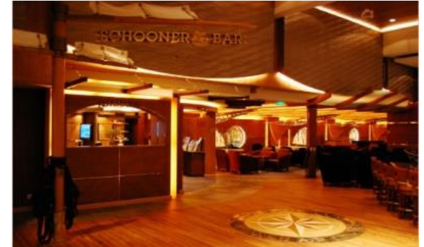
스쿠너 바 [5F]