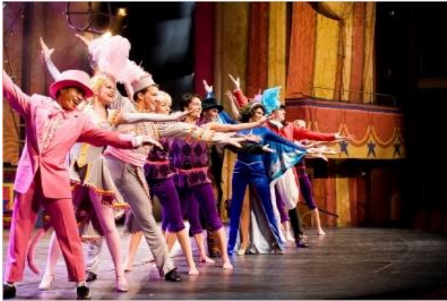
로얄 대극장 [3~5F]

저녁 식사를 전후해서 대극장에서 공연되는 브로드웨이 스타일의 공연은 저녁 시간의 또 다른 즐거움입니다. 대극장은 3, 4, 5층에 걸쳐서 위치해 있으며, 브로드웨이 스타일 공연 외에도 3D 영화 등 다양한 공연을 즐기실 수 있는 공간입니다.