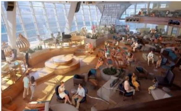
카페 투세븐티 [5F]