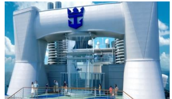
★ 유료 ★ 스카이다이빙 [16F]