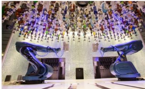
바이오닉 바 [5F]