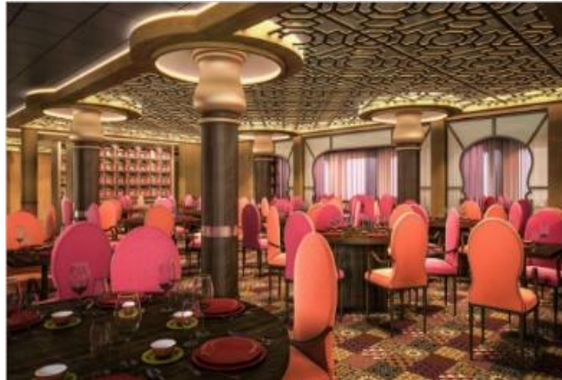
★ 무료 ★ 아메리칸 아이콘 그릴 [4F]

오븐에서 방금 꺼낸 뉴욕 스타일 피자를 맛보세요. 클래식 치즈 피자, 페퍼로니 피자는 물론, 하와이안, 초리조, 피자 플로렌티나(Pizza Florentine)까지 다양한 피자가 여러분을 기다립니다.