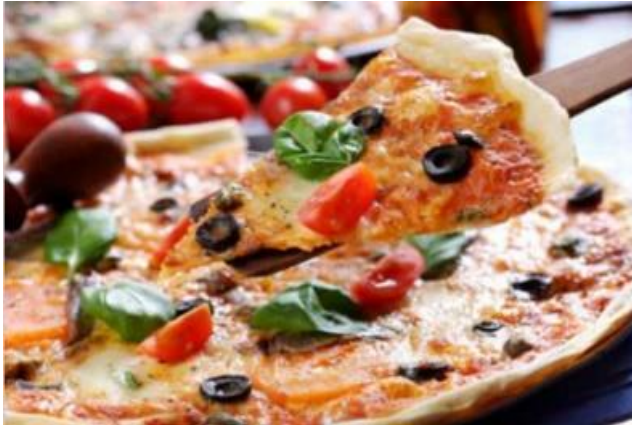
★ 무료 ★ 소렌토 피자 [4F]

오븐에서 방금 꺼낸 뉴욕 스타일 피자를 맛보세요. 클래식 치즈 피자, 페퍼로니 피자는 물론, 하와이안, 초리조, 피자 플로렌티나(Pizza Florentine)까지 다양한 피자가 여러분을 기다립니다.