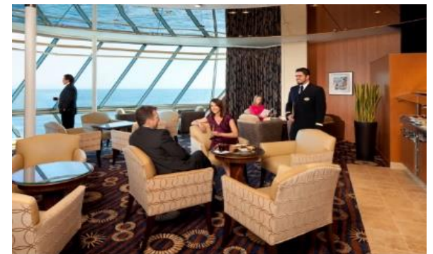
컨시어지 클럽 라운지 [12F]