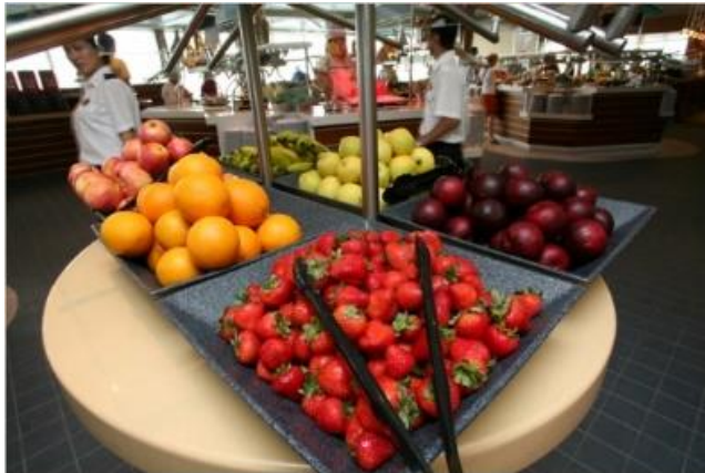
★ 무료 ★ 원재머 카페 [14F]

로얄캐리비안 선사의 모든 크루즈선에서 제공 되는 뷔페 스타일의 원재머 카페를 관탐호에서도 즐겨보세요.