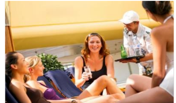
풀 & 스카이 바 [15F]