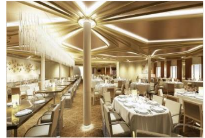
★ 무료 ★ 시크 레스토랑 [3F]

퀀텀클래스에서 새롭게 선보이는 다이나믹 다이닝의 다양한 레스토랑에서 취향에 맞는 식사를 즐겨보세요! 더 그랑에서는 클래식하고 고급스러운 유러피안 스타일의 음식들을 맛볼 수 있습니다.