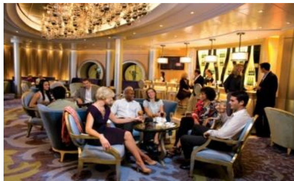
다이아몬드 클럽 [4F]