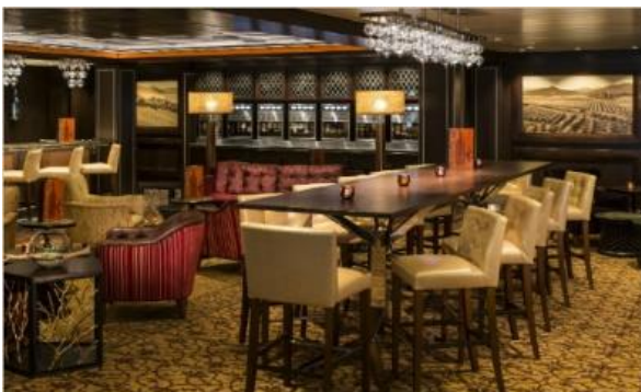
빈티지 와인바 [5F]