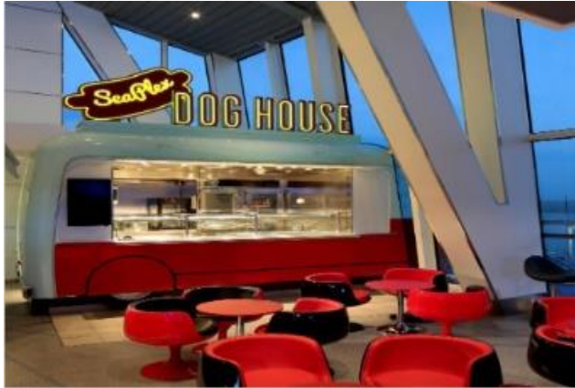
★ 무료 ★ 씨플렉스 도그 하우스 [15F]

도그 하우스는 자신이 원하는 취향대로 만들어 먹는 핫도그 가게입니다. 기본적인 핫도그에서 소세지와 여러가지 고기, 다양한 토핑을 넣어 자신만의 샌드위치를 만들어보세요.