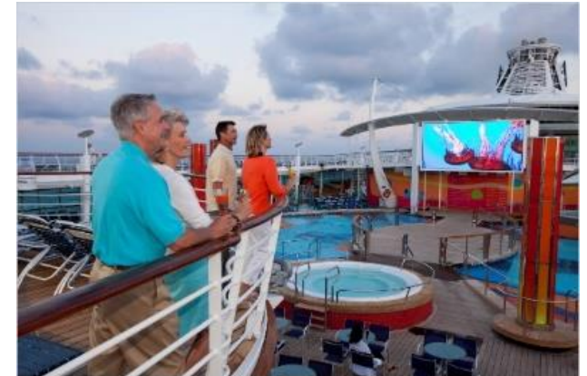
야외 무비 스크린 [4F]

라스베가스의 카지노, 몬테카를로의 카지노에 있는 듯한 느낌을 로얄캐리비안 크루즈에서 느껴보십시오. 다양한 수준의 게임이 있으며, 경험이 없으신 분들을 위한 선상 교육도 준비되어 있습니다. 항해동안 카지노 로얄은 오픈되어 있으며, 4층에 위치해 있습니다.