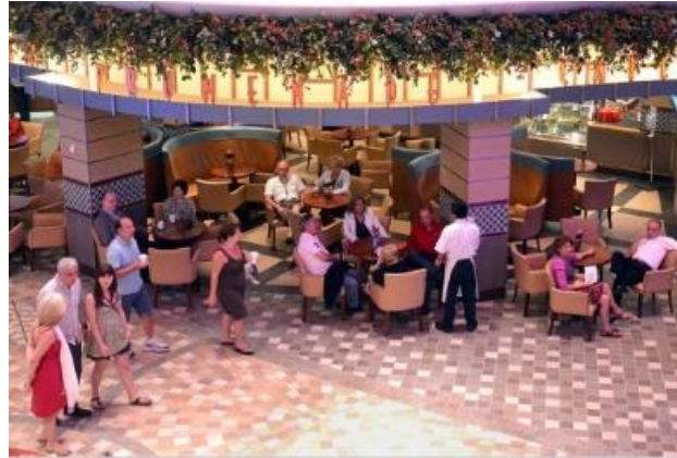
카페 프라머네이드 [4F]

도그 하우스는 자신이 원하는 취향대로 만들어 먹는 핫도그 가게입니다. 기본적인 핫도그에서 소세지와 여러가지 고기, 다양한 토핑을 넣어 자신만의 샌드위치를 만들어보세요.