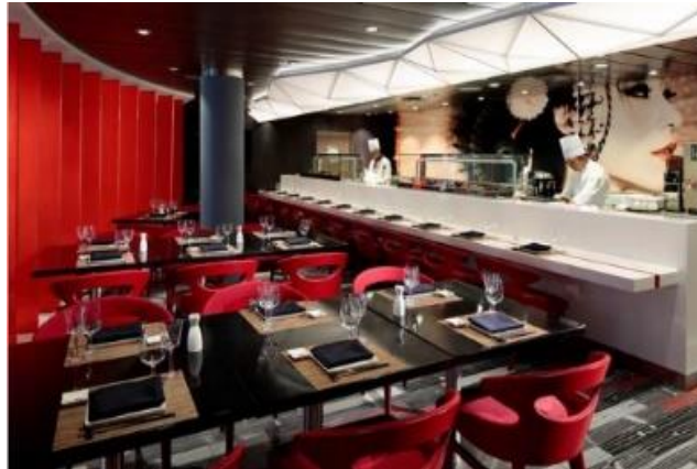
★ 유료 ★ 이즈미 [5F]

찍스 그릴은 그릴 요리를 전문으로 하는 스페셜티 레스토랑입니다. 보다 격조 높은 저녁 정찬을 즐기실 수 있으며, 사전 예약이 필요합니다. ($35 변동가능)