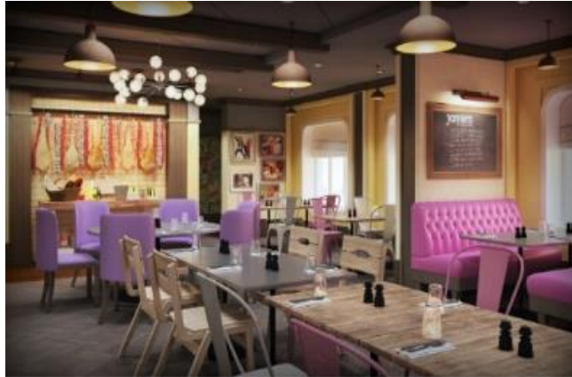
★ 유료 ★ 제이미스 이탈리아 [5F]

전세계적으로 유명한 셰프 제이미 올리버의 음식들을 만날수 있는 기회가 당신에게 찾아옵니다. 각종 신선한 해산물과 과일, 재료들을 이용한 퓨전 이탈리아 요리들을 맛보세요! (런치 $25 / 디너 $35, 변동가능)