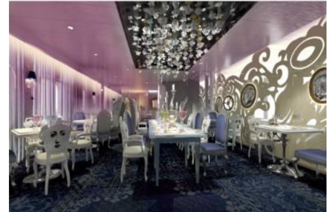
★ 유료 ★ 원더랜드 레스토랑 [5F]

이즈미는 스시 롤, 사시미, 이시야키(돌판에 구운 요리) 등 일식을 전문으로 하는 레스토랑입니다. 별도의 예약비가 발생합니다.(단품 메뉴별상이)