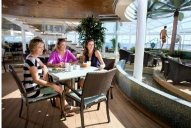
★ 유료 ★ 솔라리움비스트로 [14F]

전세계적으로 유명한 셰프 제이미 올리버의 음식들을 만날수 있는 기회가 당신에게 찾아옵니다. 각종 신선한 해산물과 과일, 재료들을 이용한 퓨전 이탈리아 요리들을 맛보세요! (런치 $25 / 디너 $35, 변동가능)