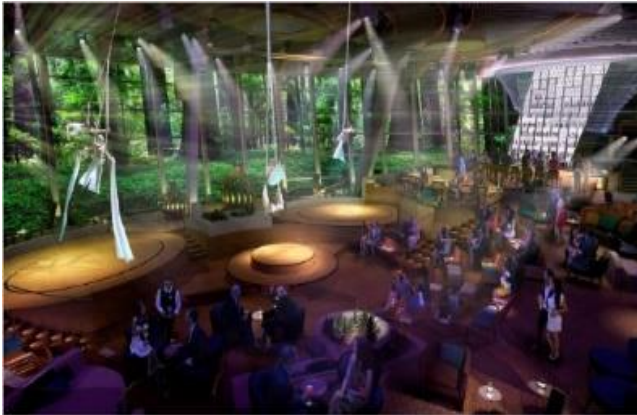
Two 70 [5~6F]

2014년 런칭을 앞두고 있는 로얄캐리비안 크루즈 캠티엄호에서는 두 얼굴의 라운지 Two70을 선보입니다. 낮에는 평온한 분위기의 라운지 Two70에서 책을 읽거나 바다를 감상하시고, 밤이 되면 스펙타클한 공연곡예를 가미한 공연을 즐겨보세요. 특히 이 반전매력을 실현시키기 위해 로봇 팔..이 대거 투입! 스테이지 배경을 환상적으로 바꿔준다고 합니다