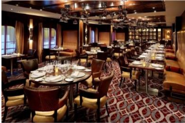
★ 유료 ★ 찍스 그릴 [5F]

찍스 그릴은 그릴 요리를 전문으로 하는 스페셜티 레스토랑입니다. 보다 격조 높은 저녁 정찬을 즐기실 수 있으며, 사전 예약이 필요합니다. ($35 변동가능)