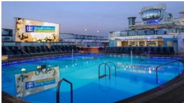
메인 수영장 [14F]