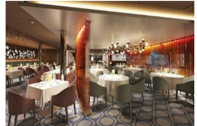
★ 무료 ★ 실크 레스토랑 [4F]

아름답고 감각적인 미국음식들을 탐험해보세요! 뉴올리언즈 스타일의 수프, 뉴잉글랜드 클램 차우더, 남미의 버터밀크 치킨요리까지. 미국의 아이코닉한 푸드여행이 시작됩니다.