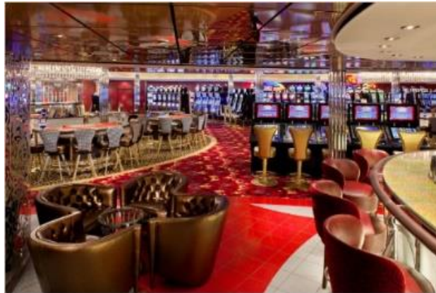
카지노 로얄 [4F]

2014년 런칭을 앞두고 있는 로얄캐리비안 크루즈 캠티엄호에서는 두 얼굴의 라운지 Two70을 선보입니다. 낮에는 평온한 분위기의 라운지 Two70에서 책을 읽거나 바다를 감상하시고, 밤이 되면 스펙타클한 공연곡예를 가미한 공연을 즐겨보세요. 특히 이 반전매력을 실현시키기 위해 로봇 팔..이 대거 투입! 스테이지 배경을 환상적으로 바꿔준다고 합니다