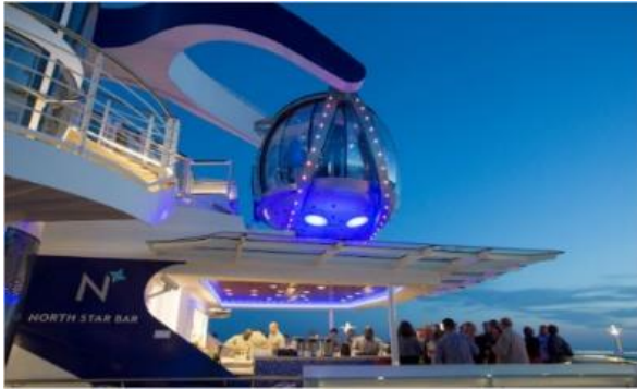
북극성 바 [14~15F]