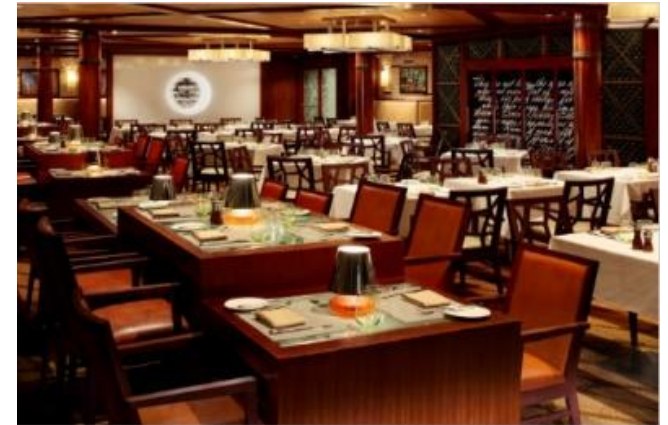
★ 유료 ★ 코스탈 키친 [14F]

솔라리움 비스트로는 건강한 삶을 지켜주는 웰빙 푸드를 선보입니다. 가벼운 식사를 즐기고 싶을 때, 별이 가득한 하늘 아래 낭만적인 저녁을 누리고 싶을 때 방문해보세요. 아침과 점심은 무료로 제공되며 저녁식사는 예약비가 필요합니다.(아침/점심:무료, 저녁: $25 변동가능)