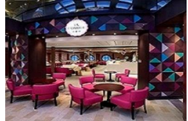
라 파티제리 [4F]

크루즈 안의 광장 프라머네이드에 위치한 카페 프라머네이드에서 하루의 일정을 계획해보세요. 시애틀즈 베스트 커피, 패스트리, 샌드위치, 그 밖의 간식거리들이 하루종일 제공됩니다.