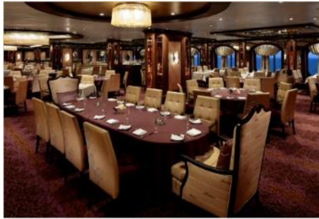
★ 무료 ★ 더 그랑 레스토랑 [3F]

아시안 음식을 비롯해 멕시칸, 이탈리아등 다양한 메뉴를 보다 편안한 분위기에서 아침, 점심, 저녁식사로 마음껏 즐기실 수 있습니다.